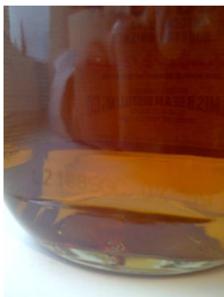
Jim Beam White