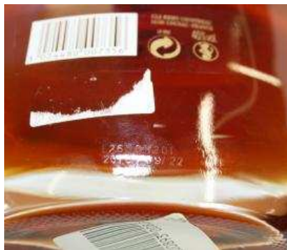
Remy Martin CDC