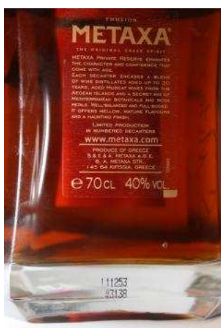
Metaxa Private reserve

Umístění: LOT je natištěn na zadní straně lahve