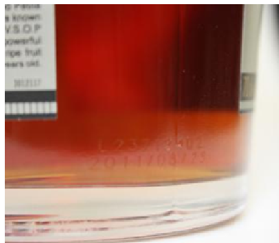
Remy Martin VS a VSOP

Umístění: LOT je na zadní straně vyleptán do skla Důležitých je prvních 5 znaků včetně písmene L !