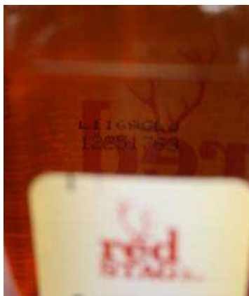
Jim Beam Red Stag