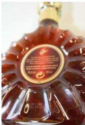
Remy Martin XO